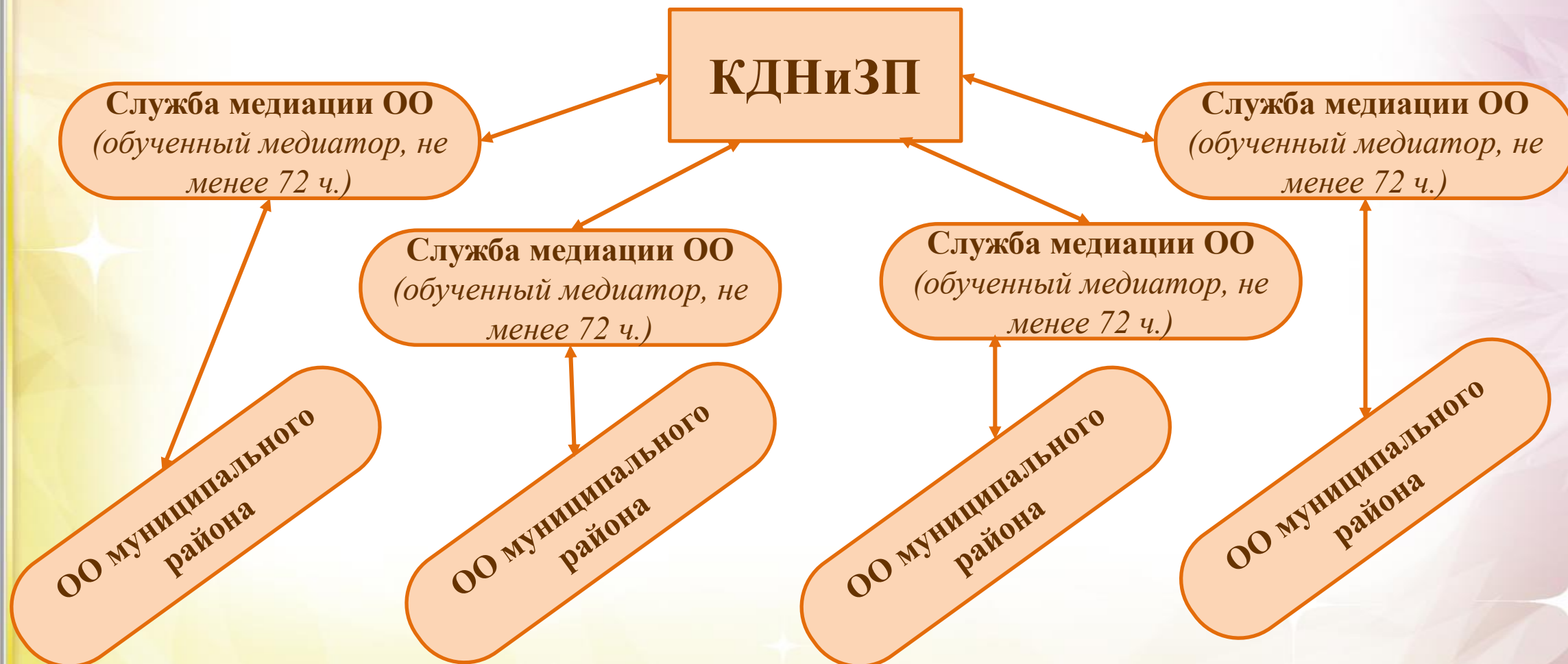
Схема работы службы медиации ОО во взаимодействии с КДНиЗП по реализации восстановительной медиации